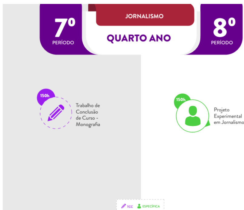
IMAGEM 6 – MATRIZ CURRICULAR DO QUARTO ANO DO CURSO DE JORNALISMO