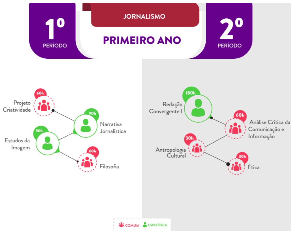
IMAGEM 3 – MATRIZ CURRICULAR DO PRIMEIRO ANO DO CURSO DE JORNALISMO