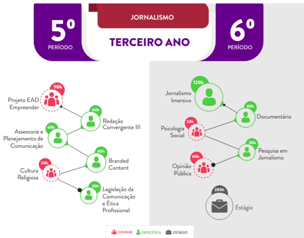
IMAGEM 5 – MATRIZ CURRICULAR DO TERCEIRO ANO DO CURSO DE JORNALISMO