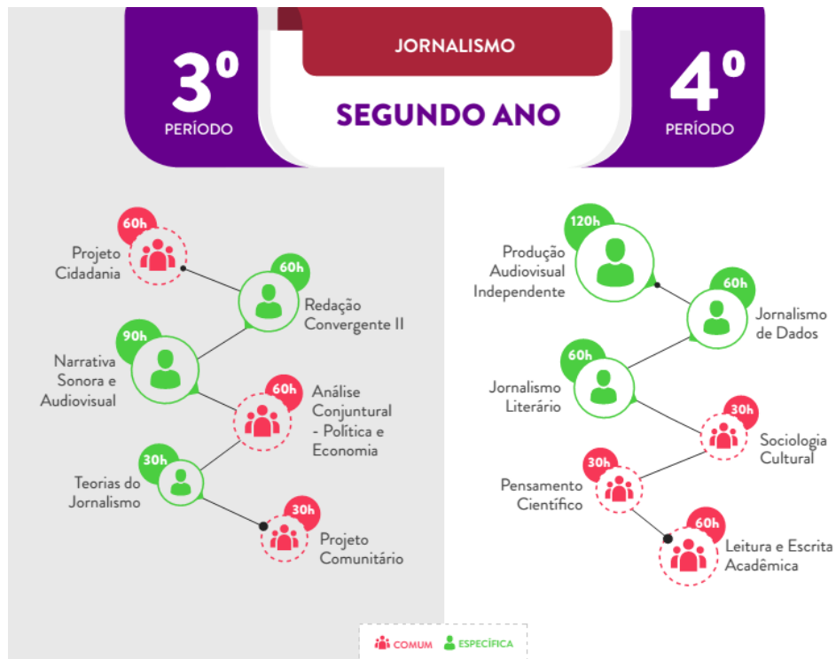
IMAGEM 4 – MATRIZ CURRICULAR DO SEGUNDO ANO DO CURSO DE JORNALISMO