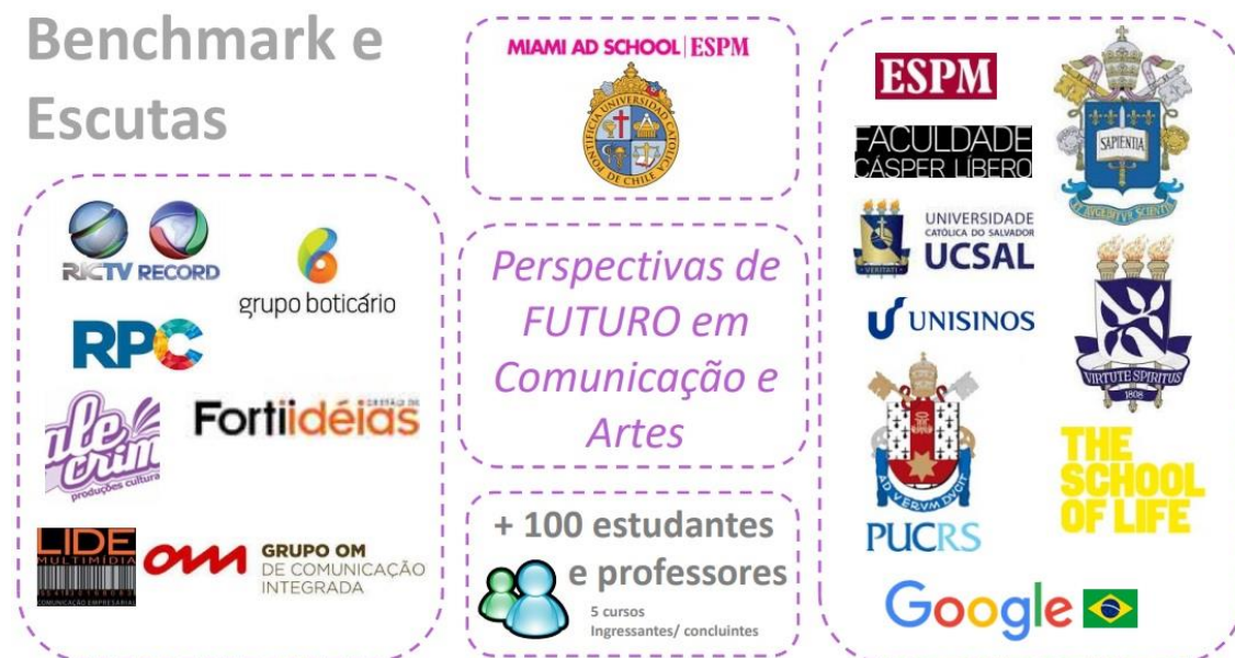
IMAGEM 1 – BENCHMARK E ESCUTAS

relacionamento entre academia e mercado, bem como as perspectivas de futuro da profissão. A figura a seguir apresenta um resumo desta etapa de forma ilustrativa.