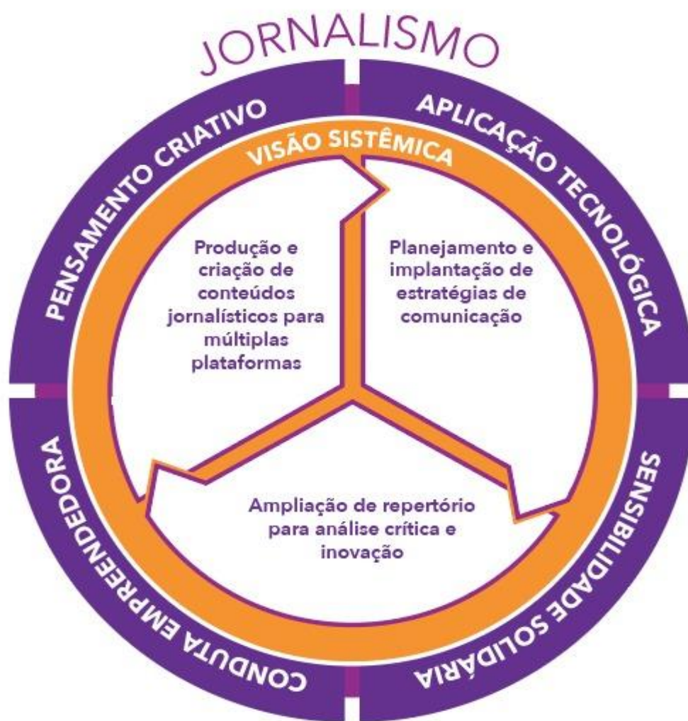
IMAGEM 2 – HABILIDADES ALMEJADAS PARA O EGRESSO DO CURSO